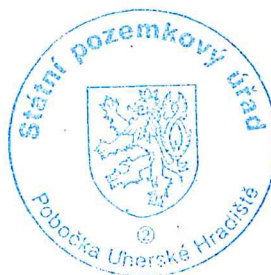
Mgr. Jiří Vávra vedoucí Pobočky Uherské Hradiště Státní pozemkový úřad

Předpokládání účastníci řízení budou písemně vyzooměni o termínu konání úvodního jednání (§ 7 zákona). Na úvodním jednání budou účastníci seznámeni s účelem, formou a předpokládaným obvodem jednoduchých pozemkových úprav. Dále zde bude projednán postup při stanovení nároků vlastníků (§ 8 zákona), popřípadě další otázky významné pro řízení o pozemkových úpravách.